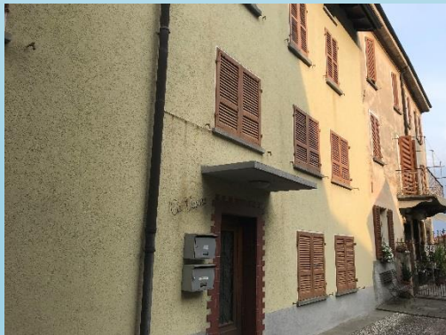
Casa nel nucleo del centro storico con solette in legno.